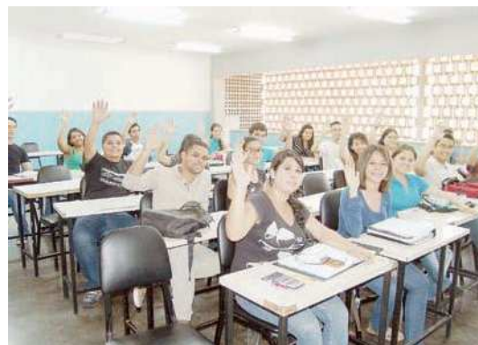
Los estudiantes del Vicerrectorado Barquisimeto de la Unexpo están de acuerdo con que se mejore el proceso enseñanza-aprendizaje de las materias de Cálculo