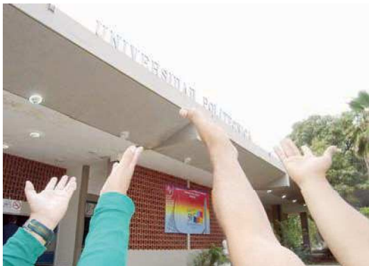
En la Unexpo Barquisimeto son bienvenidos todos aquellos estudiantes que tengan como vocación real el estudio de la Ingeniería

3. Se sugiere desarrollar actividades de reflexividad pedagógica en el área de matemática, con la finalidad de propiciar la revisión por parte del docente, de sus métodos o formas de enseñanza de cálculo.